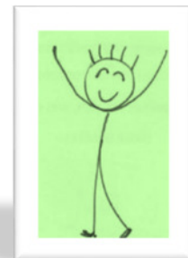
Oooooo HAPPY DAY

„Wenn man nicht selbst an sich glaubt, wer dann?“